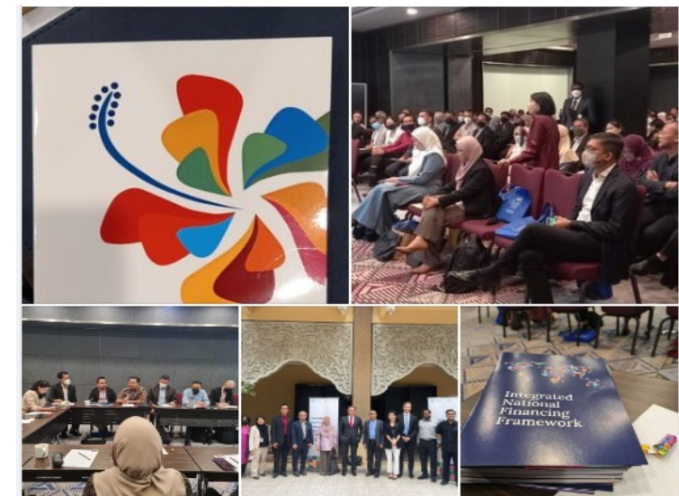
SDG@FGD Financing Putrajaya