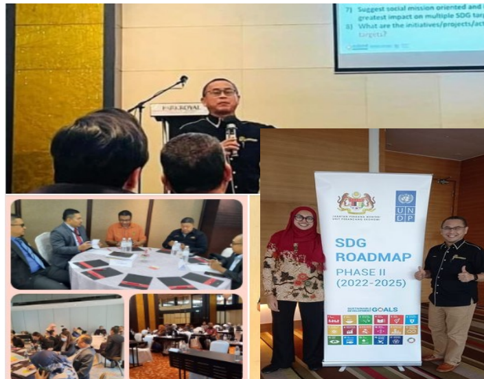
SDG@ FGD Roadmap Kuching